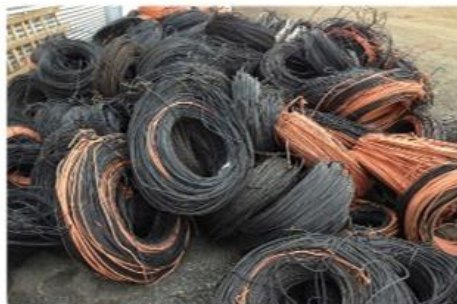
ЦВЕТНОЙ И КАБЕЛЬНЫЙ ЛОМ