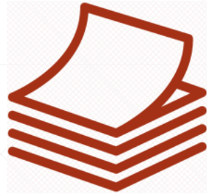
Группы товаров, упаковки